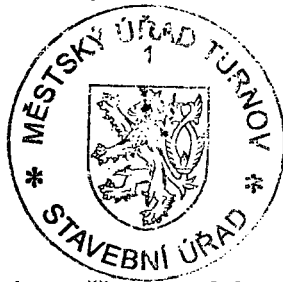
Ing. Eva Zakouřilová vedoucí stavebního úřadu

Rozhodnutí má podle § 93 odst. 1 stavebního zákona platnost 2 roky. Podmínky rozhodnutí o umístění stavby platí po dobu trvání stavby či zařízení, nedošlo-li z povahy věci k jejich konzumaci.